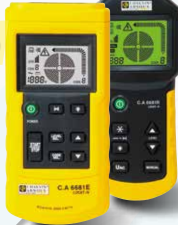
Lokalizator przewodów LOCAT-N C.A 6681