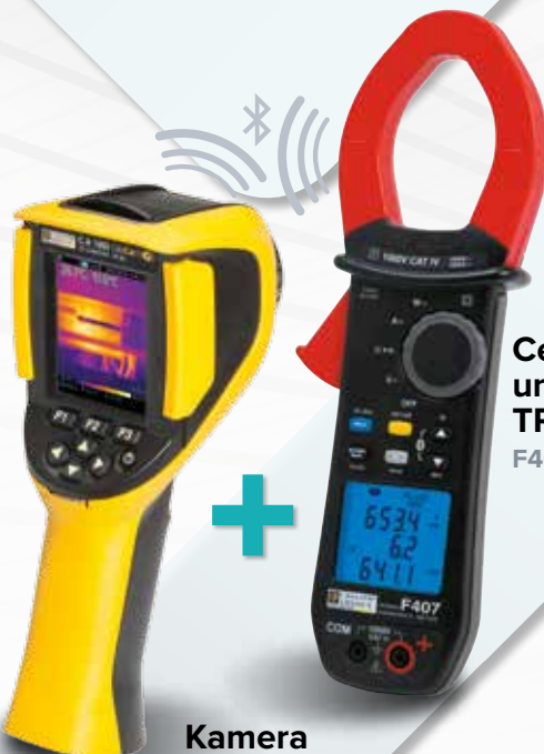
Cęgowy miernik uniwersalny TRMS F407