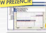
Oprogramowanie operacyjne DataView®