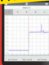
Tablet Android 8"